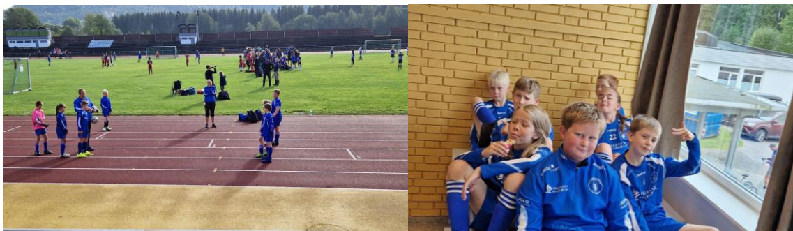
Bilde G10, fra Telemark Cup